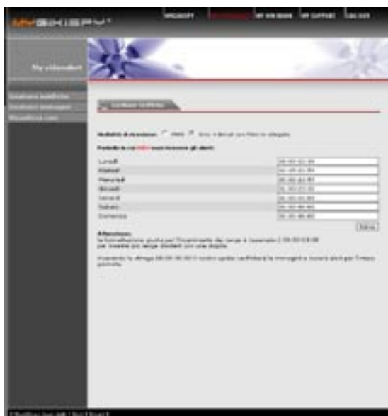
Gestione notifiche (Alert)